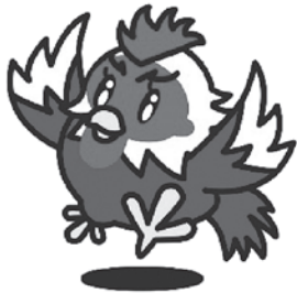
八尾のシャモヤン