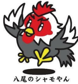
八尾のシャモヤン