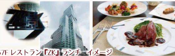
57F レストラン「ZK」ランチイメージ