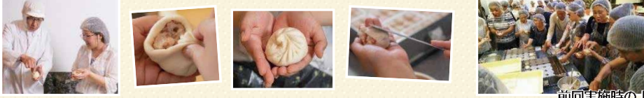
前回実施時のようす

手作り体験：豚まん4個、焼売10個(★作りたてをお持ち帰り) ラ ン チ：豚まんが蒸しあがるまでのお時間で、お店自慢の料理が味わえます