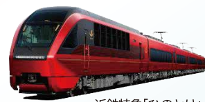
近鉄特急「ひのとり」

旅行代金 大人/ 16,600円 小学生/ 13,800円 Go To キャンペーン適用 (通常料金 大人 25,500円 小学生 21,100円) ◎地域共通クーポン付 3,000円