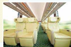
近鉄観光特急「しまかぜ」車内

行程 [1日目] 11:00 大阪難波 ——(近鉄特急「ひのとり」)—— 13:05 近鉄名古屋 (到着後自由行動) … (宿泊) コンフォートホテル名古屋伏見 昼食のお弁当をご用意 各自でチェックイン ※15:00以降 [2日目] 出発までフリー 11:30 名古屋 ===== 13:00 ※伊勢神宮(内宮) ===== 13:30 ※鳥羽 (下車後自由行動) バスにて移動 ※いずれかまで下車してください。 16:31 ※鳥羽 — 16:42 ※宇治山田 ——(近鉄観光特急「しまかぜ」)—— 18:15 鶴橋 — 18:17 大阪上本町 — 18:21 大阪難波 ※いずれかの駅にご集合ください。