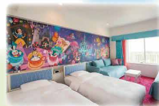
夢やファンタジーがテーマの「ウィッシュ」客室