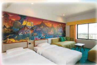
冒険や発見がテーマの「ディスカバー」客室

東京ディズニーセレブレーションホテルは、 手軽にリゾートステイを楽しめるバリュータイプのディズニーホテルです。 東京ディズニーリゾート・コーポレートプログラムにご所属の皆さまと そのご家族を対象に、 客室料金を10%割引 にてご提供いたします。