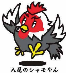
八尾のシャモヤン