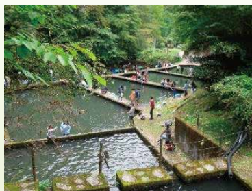
以前開催時のようす