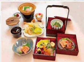
イメージ (花のいえ)