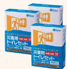
マイルットmini10(3箱セット)