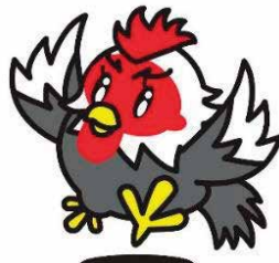
八尾のシャモヤン