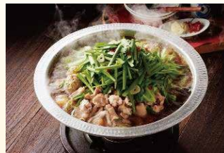
【一例】博多の味 もつ鍋セット