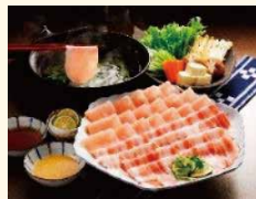
【一例】宮崎県産おいも豚しゃぶしゃぶ