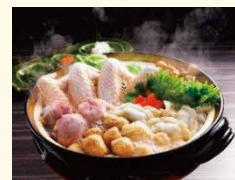
【一例】名古屋コーチン鶏鍋

メニューカタログの中から お好みの商品を1つ お選びいただき、WEB か 同封のハガキでご注文