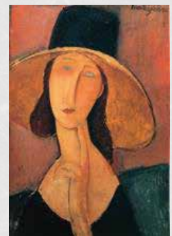
(右) アメデオ・モディリアーニ 《大きな帽子をかぶったジャンヌ・エビュテルヌ》1918年 個人蔵