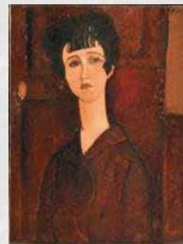
(左) アメデオ・モディリアーニ 《若い女性の肖像》1917年頃 テート