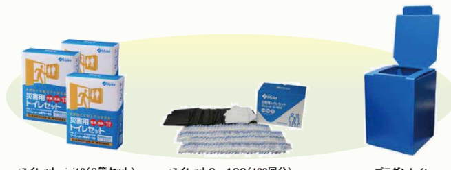
マイレットmini10(3箱セット) マイレットS-100(100回分) ブラダントイレ

会員料金 会員ご本人限定 ★お一人様2点限り ご自宅などお送り先指定OK! ※価格はすべて税・送料込