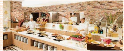
お料理はすべて、シェフがひと皿ずつ取り分け、盛りつけて提供しています。