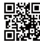
全福ネット防災シリーズ