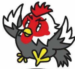
八尾のシャモヤン