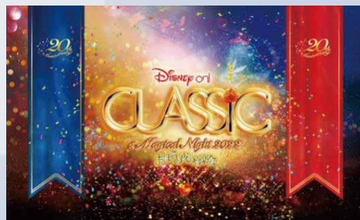
Presentation licensed by Disney Concerts. ©Disney

★公演日をご指定ください。 ※抽選結果は、当選された方のみへ8月26日(金)までに連絡します。