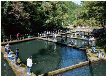
昨年開催時のようす