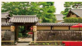
イメージ (南禅寺順正)

※いずれかの店舗(料理内容はガイドに掲載が好みで選べます。(1枚につき1名様) ※必ず事前にお電話でご予約ください。(一部施設で夜のお食事にもご利用いただけます。)