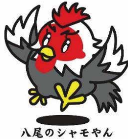
八尾のシャモヤン