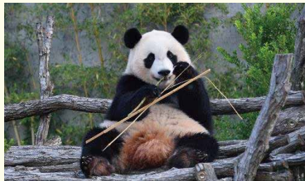
「概浜」（撮影日 2022年9月28日）

申込手順 常時当センターで申込受付（様式④『事業等申込書』にてお申込みください。）▶▶（受付後手配） ▶▶10~14日後に入園券お渡し（代金と引き換え）※利用有効期間：お渡し日より概ね半年間 ※年末年始やGWなど、さらに日数がかかる場合があります。ご不便おかけしますが、お早めのご注文をお願いします。