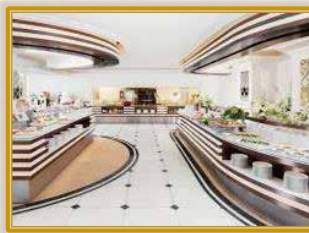
宝塚ホテルビュッフェ&カフェレストラン アンサンブル

申込方法 毎日新聞旅行【FAX】06-6346-8801へ、下記要綱にてお申込みください。 ★申込書を当センターHPからダウンロード・印刷いただき、下記必要事項をご記入ください。 ①会員事業所名及び同電話番号 ②会員の【氏名・年齢・会員番号・住所・連絡先の電話番号】 ③同行者の【氏名・年齢・会員区分】 ※申込書の印刷が困難な方は、上記内容を明記の上(書式不問)お申込みください。