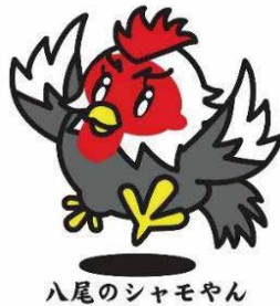
八尾のシャモヤン