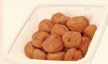
訳あり お得パック【内容量】580g イメージ (あまあま 3%)