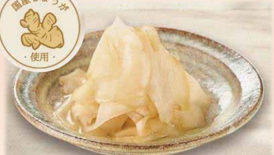
しょうが漬け【内容量】150g イメージ (あまあましょうが)